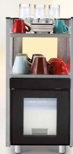
CHILL & CUP

Beide te combineren met alle modellen van koffiemachines